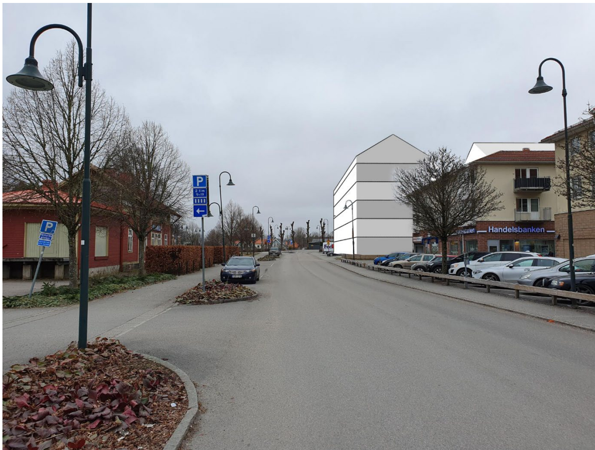
Bilden visar ett fotomontage av planförslaget från Stationsvägen mot väster.